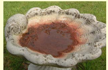
Geen slijm of algen groei met Aviclens!

Bij gebruik van Aviclens in het laatste spoelwater zal het kiemzaad langer vers blijven in de kooien.